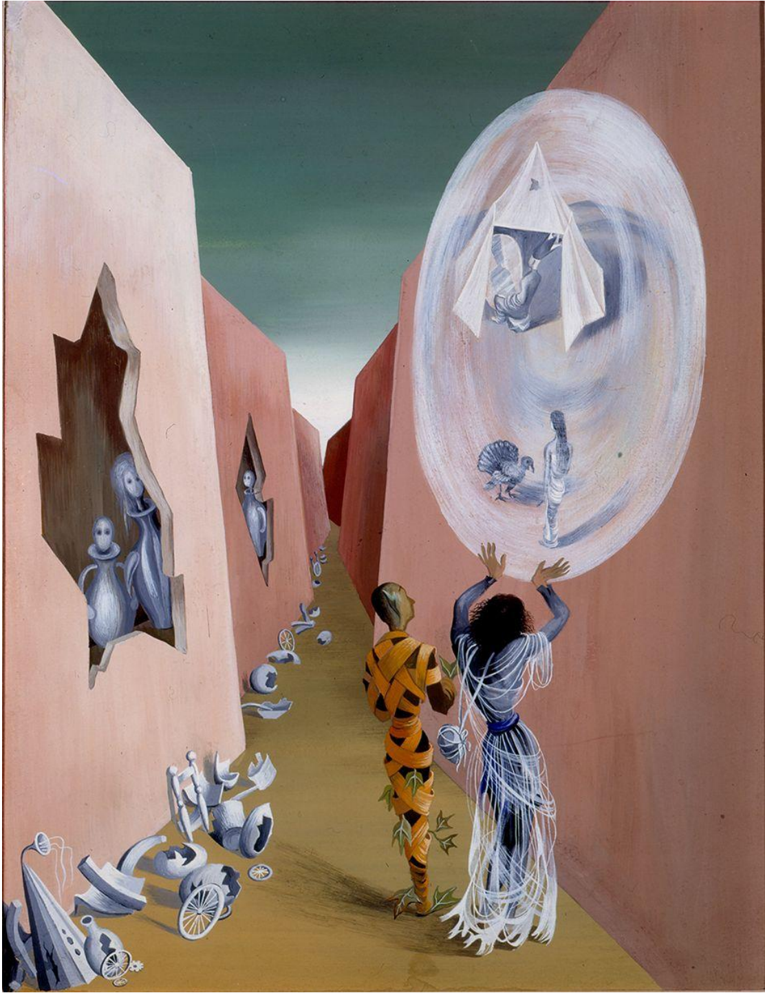
Cuadro VII. Remedios Varo: GITANA Y ARLEQUÍN.