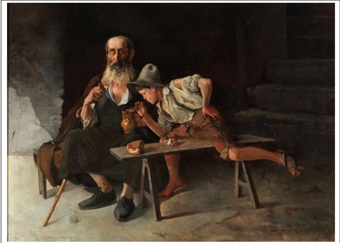
CUADRO IV: El Lazarillo de Tormes.